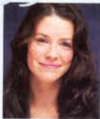
EVANGELINE LILLY, 29, kanadische Schauspielerin (bekannt aus der Mystery-Serie „Lost“), in Gala

Im Flugzeug streiche ich mir immer Handcreme in die Nase. Das schützt mich vor Infektionen