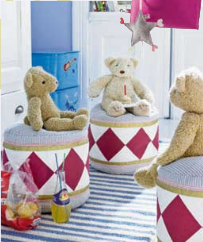
Oben rechts: „Utensilo“ bewahrt kleine Geheimnisse dekorativ auf (je ca. 39 Euro, Djou Djou Design). Oben: Für Puppen- und Bärenpartys (Kindersitzpouf ca. 33 Euro, Car Möbel).